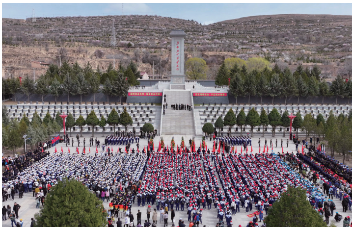
▲固原二中和弘文中学连续29年开展祭英烈活动

坚持正确政治方向、舆论导向，着力统一思想、鼓舞斗志、汇聚力量。一是壮大主流舆论。把思想政治工作融入主题宣传、形势宣传、政策宣传、成就宣传、典型宣传当中，大力宣传黄河流域生态保护和高质量发展先行区建设进展，讲