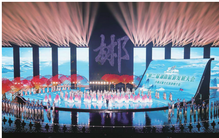
▲第二届湖南省旅游发展大会开幕式暨文化旅游推介会在郴州市举行

深入开展专题调研，全面梳理当前工作中存在的问题，抓短板弱项、抓重点难点、抓督查督导，以文明创建持续增强人民群众的幸福感和获得感，不断释放精神文明建设的“红利”。创新开展“和美”小区创建活动，按照“四和四美”要求，成功打造“和美”小区50个。目前全市9个县市全部获得省级文明城市称号，获评全国文明单位19个、全国文明村镇25个、全国文明家庭2户、全国最美家庭22户。